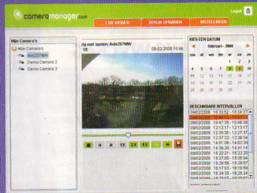
Online opnamen bekijken op Cameramanager.com.

We namen de proef op de som en bestelden een totaalpakket. Er wordt geen draadloze camera geleverd, maar een Panasonic HomePlug-setje om de netwerksignalen via de elektriciteitskabel te laten verlopen. Dit werkt in de meeste gevallen prima, behalve in woningen met een groepenkast die sterk filtert. De installatie van de camera was een fluitje van een cent: het volstaat om de camera